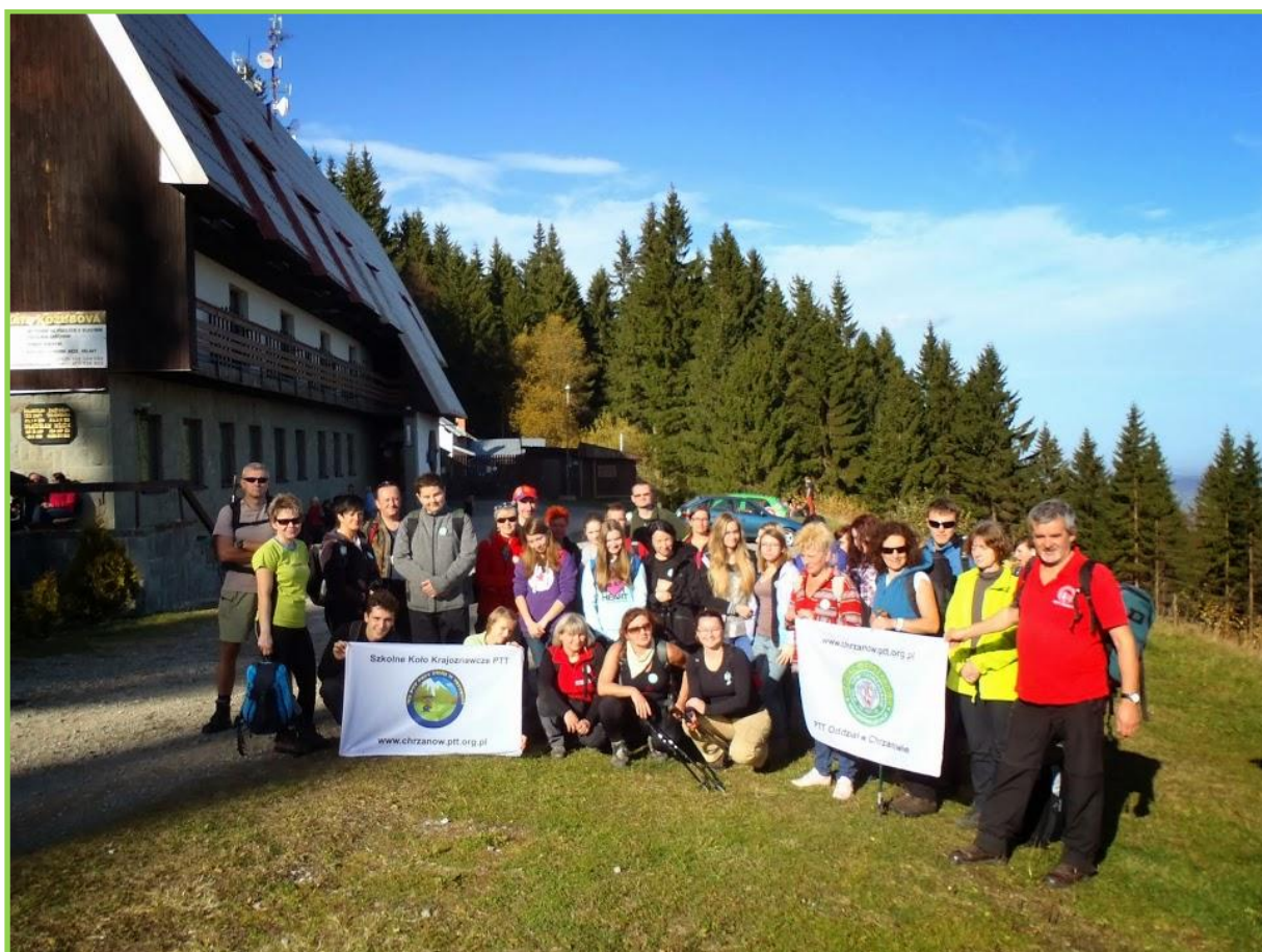
Zespół Szkół Ekonomiczno – Chemicznych w Trzebini